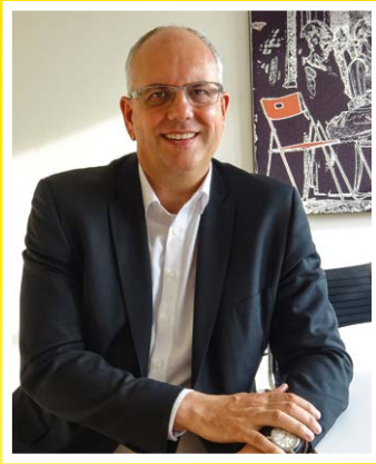
Liebe Weyherinnen Liebe Weyher,

zukunftsfähige und nachhaltige Mobilität sichert die Wohn- und Lebensqualität in einer Gemeinde. Deshalb setze ich mich als Bürgermeister der Gemeinde Weyhe für die Stärkung und den Ausbau umweltfreundlicher Verkehrsträger ein.